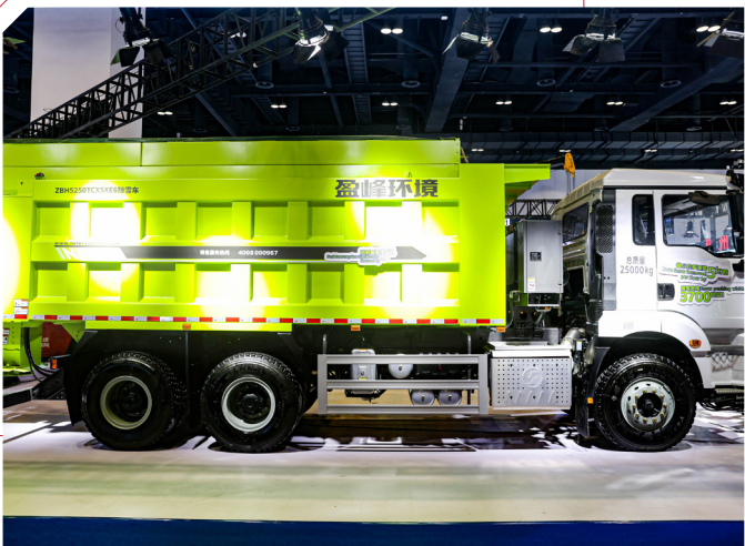
防灾减灾救灾装备展区