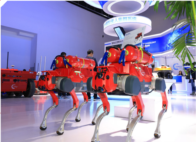
综合性消防救援装备展区